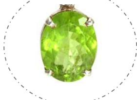
画像・天然石、パワーストーン辞典より