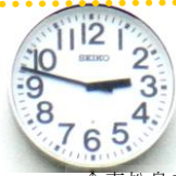
↑東松島市野蒜駅の時計の写真

言葉を見失いました。想像絶するとは、このような事を言うのかと、ただただ、涙が出てきて、言葉を失いました。