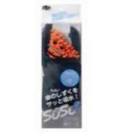
画像はHP ケンコー コムより 上・靴の除湿剤 下・傘ケース